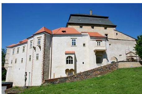
Zámek v Miroslavi – prostor pro koncerty

Vedení komorního orchestru: Jan Škrdlík // UPOZORNĚNÍ: Přečtěte si na následující straně „Miroslavské desatero“. Dozvíte se v něm, o čem kurzy jsou a o čem nejsou. Můžete se zamyslet, jestli Vás tato aktivita oslovuje, nebo ne :-)