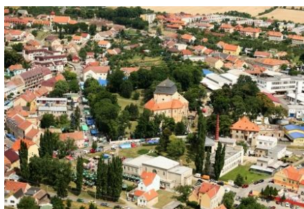
Malebné jihomoravské městečko Miroslav