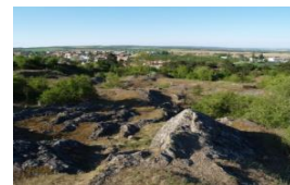
Národní přírodní památka „Miroslavské kopce“

Vedení komorního orchestru: Jan Škrdlík // UPOZORNĚNÍ: Přečtěte si na následující straně „Miroslavské desatero“. Dozvíte se v něm, o čem kurzy jsou a o čem nejsou. Můžete se zamyslet, jestli Vás tato aktivita oslovuje, nebo ne :-)