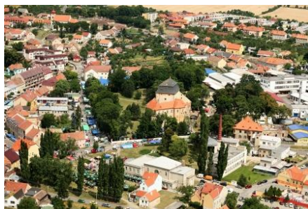
Malebné jihomoravské městečko Miroslav