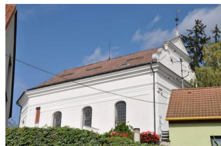
Evangelický kostel – jiný koncertní prostor

Vzhledem k velmi nízké ceně kurzů (převyšující cenu obědů, které jsou zdarma) je ubytování velmi sportovní, ve spacácích v budově synagogy, ale je pochopitelně možné zařídit si/vytelefonovat si vlastní ubytování ve městě na vlastní náklady. Vzhledem k rodinnému charakteru kurzů se bude další upřesňování (příjezdy, placení apod.) dít osobně, individuálně.