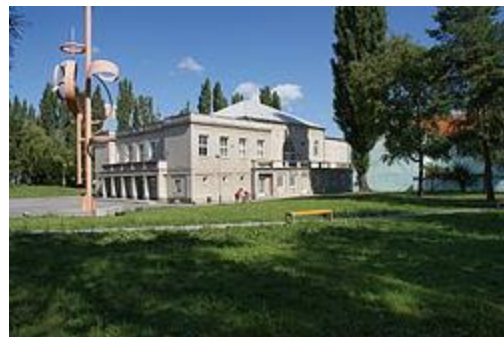
Budova synagogy v Miroslavi

tak tady máme šestý ročník hudebních kurzů v Miroslavi. Pro ty, co zde ještě nebyli: V tomto malebném městečku na jihu Moravy nedaleko Znojma jsme již pětkrát prožili nádherné chvíle s hudbou, ale i koupáním, procházením blízko národní přírodní památkou „Miroslavské kopce“, romantických večerů v bývalé synagoze, kde se zkouší i spí, i mnohých dalších aktivit, a já Vám zasílám informace o letošním, sedmém ročníku, který bude jistě neméně krásný. Opět se bude jednat o sestavení malého smyčcového orchestru a souvisejících menších komorních skupinek, které budou nacvičovat a koncertovat v týdnu od pondělí 1. srpna do neděle 7. srpna 2022. Tak jako již šest let po sobě díky podpoře kurzů městem Miroslav je i letos výhodou téměř nulová cena kurzů (viz níže).